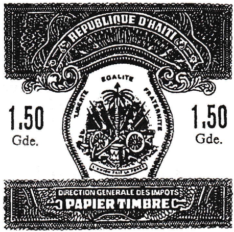
Une Gourde cinquante centimes