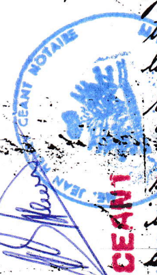
PHOTO COPIE CONFORME A L'ORIGINAL VISE PAR M. JEAN-HENRY CEANT NOTAIRE FUSIONNE

Registree a la Croix-de-Bouquet ce premier Juin mil neuf cent